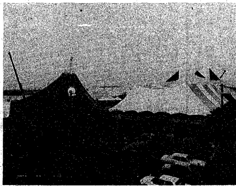
メインゲートもでき上がり最後の準備に忙しい博覧会場(6月17日)