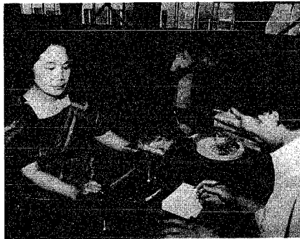
グラム数はあっているかな? (計量する市職員と見守るくらしのレポーター)

「計量記念日」の六月七日、市では、くらしのレポーターの協力を得て、購入した商品が正確かどうかを調べる「商品量目検査」を行いました。その結果、約七十七％の商品が正確で販売されていることが分かりました。