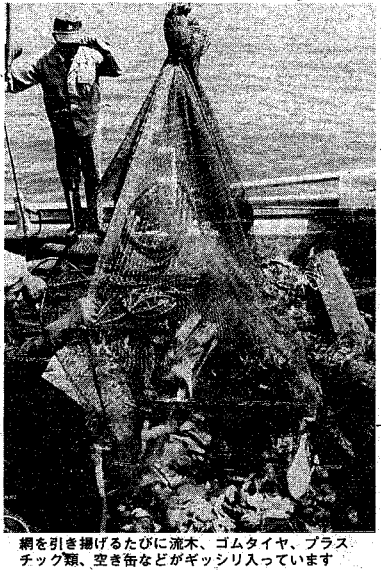
網を引き揚げるたびに流木、ゴムタイヤ、プラスチック類、空き缶などがギッシリ入っています

板びき船で操業する漁民は、を覆いつくそうとしています。新潟川、阿賀野川などの沖合、海域を漁場に、カレイやヒラメを取って生活をしてい