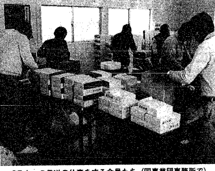
「県史」の発送の仕事をする会員たち (同事業団事務所)

お年寄りの生きがいと就労の場である「高齢者事業団」(野口市弥会長)では、このほど昨年度の実績をまとめた。それによると、仕事の実績件数は六百七十件(前年度千二百三十三件)で、〇%増、契約金額が約六千九百万円(同、六千五百万円)の六割増と、順調な伸びを示している。