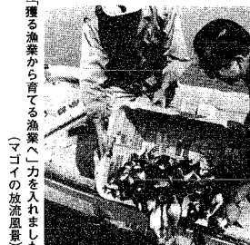
「育てる漁業」に力を入れる