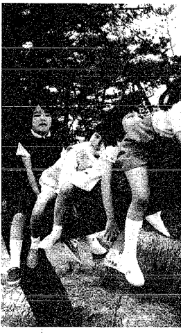
元気に遊ぶ子供たち

西内野に ひまわりクラブ... 西内野地区に、ひまわりクラブを設立... 児童福祉