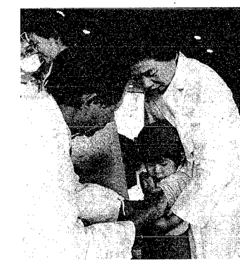
接種を受ける前と受ける時の注意 接種を受ける前と受ける時の注意 接種のあとの注意

はしかの接種は、麻疹(はしか)の予防接種は、「新野市麻しんはしか予防接種委員会」が実施し、接種券を交付し、接種会場へ持参して接種を受けることとなります。