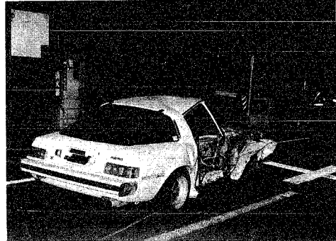
いつ起こるかかわからない交通事故に備えを

昭和五十八年度「交通災害共済」の加入申し込み受付が始まりました。この制度は加入者が交通事象により災害を受けた場合、会員相互助け合いの趣旨で、見舞金を支給するものです。万一の場合に備え、家族をろって交通災害共済に加入しましょう。 今年度昨年四月〜十二月交通災害共済に加入した人は十七万六千八百九十一人、一方、交通事象に遭った見舞金の支給を受けた人は五百四十九人で、支給額は三千六百七十三万円に上っています。 現在加入している人は、共済期間が三月三十一日で終わりますので、新年度も引き続き加入の手続きをお願いします。また、加入していない人は、ぜひこの機会に加入されるようにお願いします。 加入資格 市内に住所のある人は、どなたでも加入できます(加入後、共済期間中に市外に転出しても有効です)。 会費 大人も子供も年齢一人三百五十円(途中加入も同額です) 共済期間 四月一日〜翌年三月三十一日(四月一日以降の途中加入は、申し込みの翌日から) 見舞金 災害の程度により支給されます。(表一)