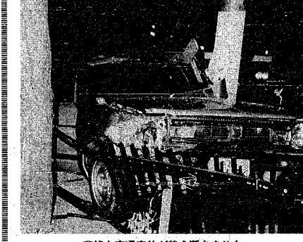
悲惨な交通事故が後を断ちません

日 時 2月10日午前10時~正午、午後1時~3時 会場 老人憩いの家「石山荘」 対象 60歳以上のかた ※午後からは医師による相談もあります。