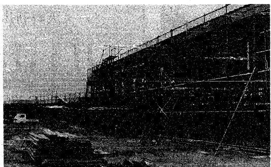
鳥ビッチで工事が進む「みのり園」。右側が体育館

市内藤野木で建設が進められているミニコロニー精神薄弱者更生施設「みのり園」は、来年四月一日の開所を目指し、急ピッチで工事が進められています。