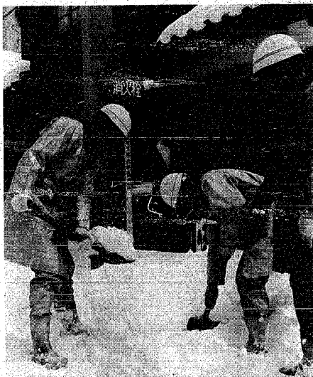
雪に埋った消火栓を掘る消防隊員

市では、除雪のため冬期間 (十二月十五日と来年三月十 五日まで)臨時駐車禁止区間 を設けたりするなど所轄警察 署と協議を行い、冬期間の臨 時交通規制を実施し、冬の交 通確保につとめます。