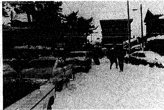
路上駐車は除雪の大敵。除雪がなかなかかどりません。

機械除雪をしようと、夏の だ降雪がこない」「私の前 前や駐車場の出入口がふさが の道路は除雪しないで欲しい」 れた、何とかしろ」とか「ま など市民の皆さんからおし 上駐車があれば除雪できま せ