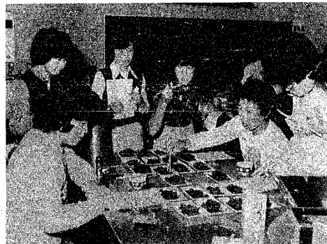
「これはどうか？」漬け物の味見をするレポートの皆さん

これは、減塩が叫ばれている中で、漬け物の塩分と賞味の関係を明らかにすることを目的にしていました。昨年はみそとしょうゆについて実施しました。