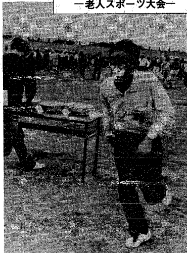
お化装して美人でしょう？メリケン粉をかぶせたアメを手を使わずに口にくわえゴールへ