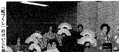
松づくしのげいに遊ぶ芸妓の皆さん