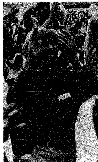
「歓喜の市民応援団」

川上市長（中央）も市民応援団の先頭に立って懸命の応援。六回表に先制の1点を入れ、なおもチャンスが続き、一塁側スタンドが大いにわきました。