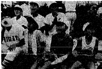
「お兄さん頑張れ」ちびっ子たちも甲子園にかけつけ、お兄さんたちのプレーに懸命の声援。「カットバセ」と声を限りの応援をされていました。