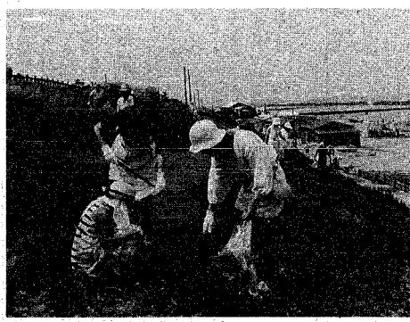
「きれいな砂浜に！」と清掃する皆さん(日和山浜で)

海水浴シーズンを迎え、市内各地で海岸清掃が活発に行われていす。さる七月十八日には、きれいなまちづくり運動実行委員会、内野小PTA、五十嵐中学校区健全育成協議会が、それぞれ海岸クリーン作戦を展開しました。 「きれいなまちづくり運動」をスローガンに、窪田町・日和山・二葉町で、海岸清掃を行いました。実行委員会は、市民みんぞう、田町・日和山・二葉町で、海岸清掃を行いました。