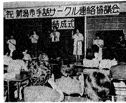
「7グループで頑張りよう」と開かれた結成式