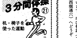
椅子に手をついて、ピョンピョンと跳ねます。