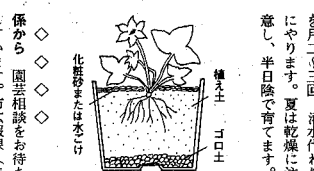
を月二、三回、灌水代わりによりやります。夏は乾燥に注意し、半日陰で育てます。

自生地は、花の色、葉の形など、大変異なっており、一株として同じものがなければならず、耐寒性の指標も、冷涼な気候を好みます。夏の高温と乾燥に注意すれば、管理は難しいことはありません。植え替え時期は生長期の、あとは薄いハイポネックスを定期的に与えます。