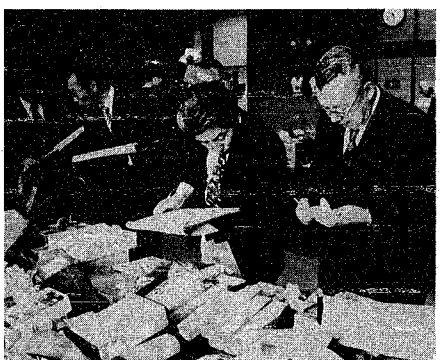
会場での審査風景。225点が合格しました。

注 ①泳法教室申し込み者は、必ず受け下さい。受け下さない場合は無効となります。②資格テストの結果、定員をオーバーした場合は、未受講者および高学年を優先します。