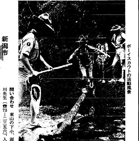
ボーイスカウトの活動風景

新潟市 児童合唱団 演奏会、各地の少年少女合唱団との交友や合同演奏会、夏休みの合唱など、楽しい練習の中に、楽しい行事がいろいろあります。対象：新四、五、六、七、八、九、十、十一、十二年生。練習日：土曜日の午後または日曜日の午前。会場：音楽文化会館。団費：年四、五、六、七、八、九、十、十一、十二年生、それぞれ異なる。申し込み：三月十日までに、各小学校の音楽主任へ。問い合わせ先：事務局 森川岸町一丁目(電話四四四四)へ。