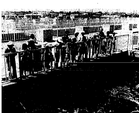
「動く市政教室」で中部処理場を見学する親子

申し込みは明日から 市では、「動く市政教室」の昭和五十七年度(五十七年四月、五十八年三月)の団体利用申し込みを、明日(二十日)から受け付けます。 市政へ理解、勉強の場としてお気軽にご利用下さい。