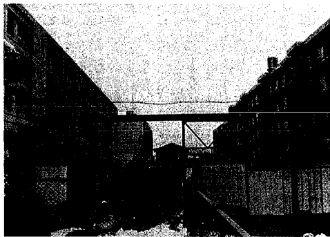
完成間近の松浜団地

昨年からの建設を進めていた市営「松浜団地」の二棟八十戸がまもなく完成します。 入居予定日は四月一日ですがそれには先だ、明日から入居者の募集を開始します。