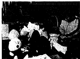
動物のぬいぐるみを製作中の入所生

知能は、小学校低学年程度で、単純な反復作業がうまい。最近ではミシンの練習を始めた。縫い物も上手で、先生の手助けがなければ「一幼稚児」も編んでくれた。今度布のとき、はしかにかなり高熱が四十度ぐらい続いた。 入所。作業は体で覚える度である。過去、現在、未来の時間の流れがわからない。文章はほとんど読めない。障害の原因は、はっきりしていない。「幼稚児」も編んでくれた。今度布のとき、はしかにかなり高熱が四十度ぐらい続いた。