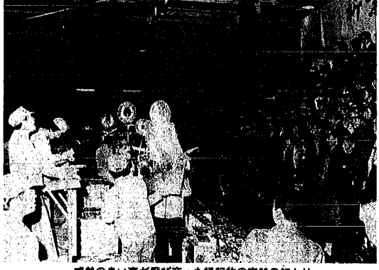
威勢の良い声飛び交った縁起物の宝船の初セリ

が万代橋一八千十間の信濃 川べりで行われました。たく さんの見物人が見守る中、サ イレンと赤旗を手に数十分