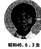
昭和45. 6. 3生