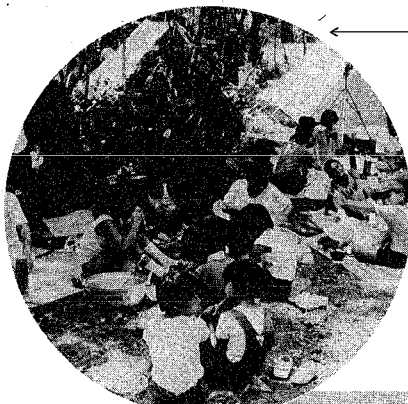
青少年三川自然の森がオープン 東蒲原郡三川村に建設されていた、青少年三川自然の森が八月一日にオープンしました。シーズン中の利用者数は、延べ五七〇九人。キャンプを楽しむ子供たちの歓声が響きました。