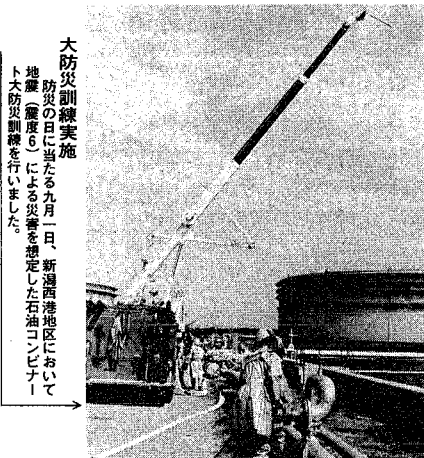
大防災訓練実施 防災の日にあたる九月一日、新潟西海地区において地震(震度6)による災害を想定した石油コンビナート大防災訓練を行いました。