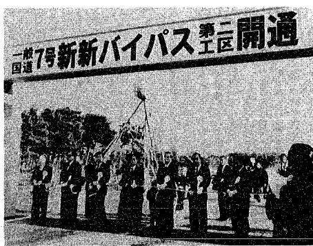
テープカットに臨む川上市長（右から3人目）ら関係者