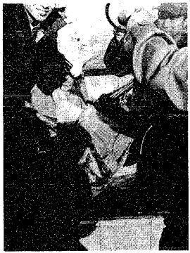
クロロソイの生体と魚礁の効二十七日、日本海区水産研究所を追跡調査する。十月、所、県水産試験場、市水産課