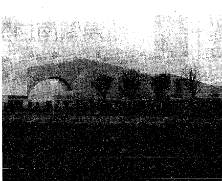
「科学の箱船」を基本イメージとした県立自然科学館