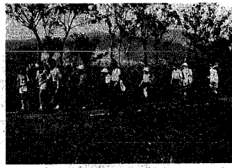
弥彦を目指して進む参加者たち

長三十五歳、全長三十五歳に挑みました。この会は①老人の体力への自信を子供に交通安全の自覚を伝える。②町内の散歩を目的に行っているもので、今年で二回目。参加者は八十二歳の藤屋