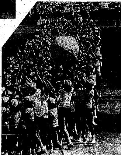
大玉送り 東地区の女子による大玉送り。ゆけるような青空に赤と白の大玉がはみみ、宙に舞いました