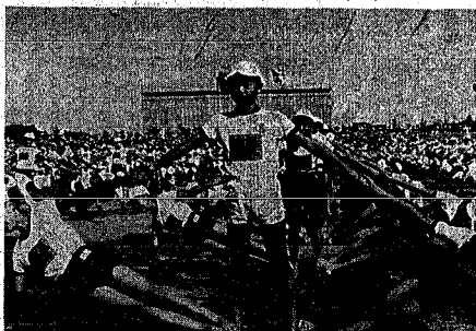
ふるさと新潟 東地区男子による、ふるさと新潟を表現する力強く美しい組立て体操