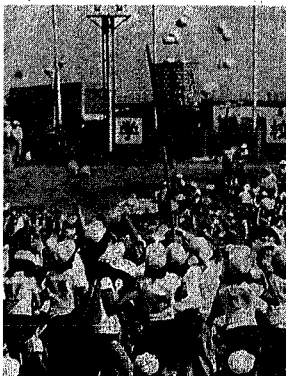
玉入れ かごめがけてエイッ／フィールドいっぱい紅白の玉が飛び交いました