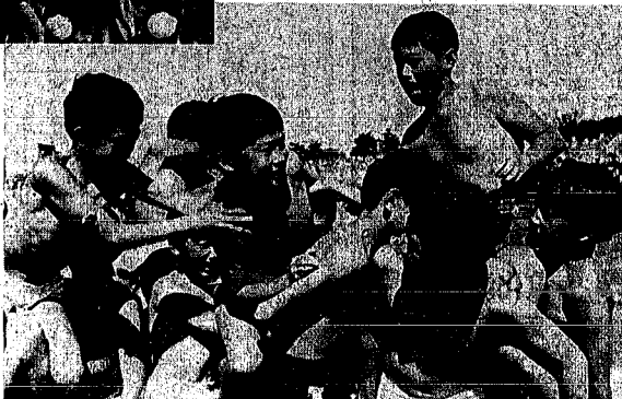
騎馬戦 東地区の男子五百三十四騎のほかに馬、猪子かまたに現代版源平の決戦