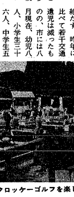
クローカーゴルフを楽しむ参加者

交通遺児が Sランドで楽しむ 「逆境に負けないで頑張ってください。」そして大いに楽しんでください。十月十三日、市交通対策協議会主催の交通遺児激励のついでバスハイ