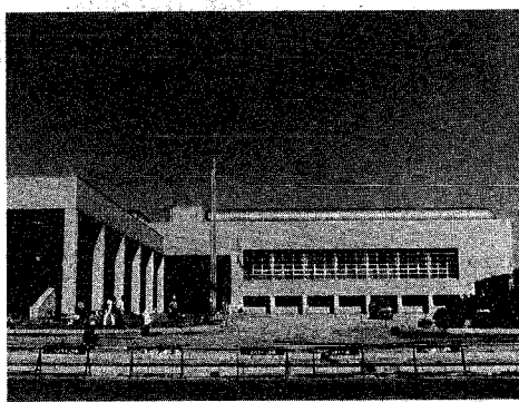
10月1日オープンした鳥屋野総合体育館。左側が屋内プール