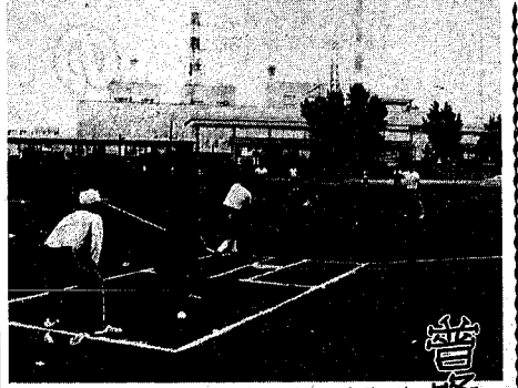
元気いっぱいプレーする生徒たち（ソフトボール）

夏休みよ子の映写会 日時 8月1日午後7時～8時半 会場 有明児童センター 対象 小学生、幼児、同伴者 フィルム 「海底3万里」（カラー60分） 「ドラエモン交通安全」（カラー15分） ※無料ですが、夜ですので同伴者と一緒においでください。