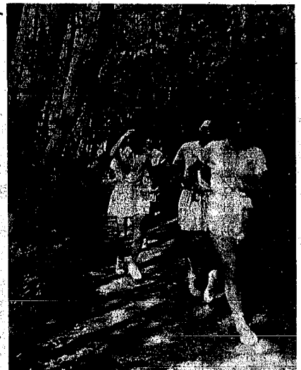
遊歩道では、お母さんたちがランニング中