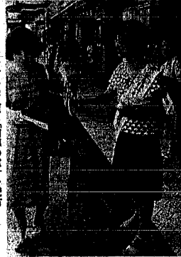
古町十字路で「補導の意」を配布

市青少年補導センターでは、夏休みを前に控えた、七月十六日、市内十二所の繁華街で、補導の意を市民に手渡す、子ども達の非行防止と健全育成を訴えました。この街頭啓発活動は、今年で二回目。古町十路、新堀、万代、小針、小針十字路など、街頭補導の皆さんが、計七千枚の補導の意を配布しました。