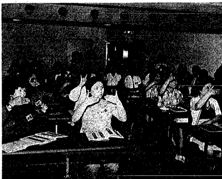
指文字の練習をする受講者(社会福祉センターで)