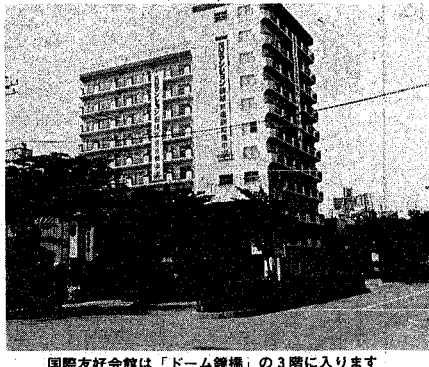
国際友好会館は「ドーム鏡橋」の3階に入ります

六月定例会議が、六月二十四日から七月日まで予定で開かれています。今回提案されている議案は、一般会計補正予算、新潟国際友好会館条例と青少年自然の森条例の制定、第三小針中学校(仮称)校舎新築に伴う契約の締結、市条例から不効用語を削除する条例の一部改正となる全部で五十二件です。