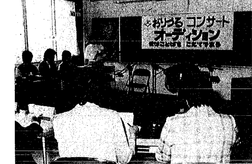
オーディション 障害者から寄せられた詩は約100編にも達しました。4月19日には、オーディションが行われ、発表曲20曲が選ばれました。(坂井輪地区公民館で)

どんなコンサートに？ 「くおりづるコンサート」を成功させるため実行委員会を結成。毎週土曜日ボランティアアパニューロに集まり、話し合いが行われました。