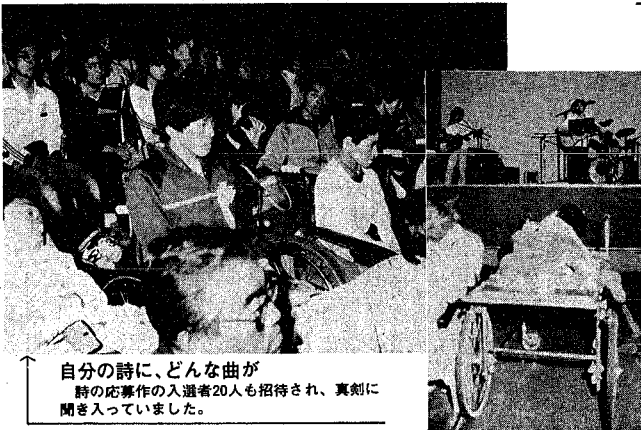
自分の詩に、どんな曲が 時の応募作の入選者20人も招待され、真剣に聞き入っていました。