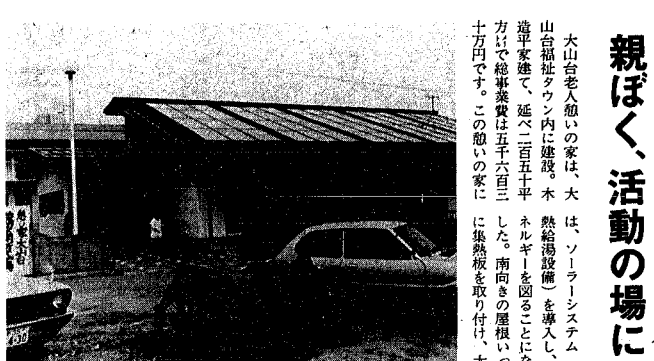
屋根いっばいに集熱板を取り付けた大山台荘

60年度予算案を可決 三月定例会市議会終わる 三月五日から二十八日まで開かれた三月定例会市議会は、五十六年度予算案など五十七議案をいっすも可決、同意し閉会しました。 同意された議案は、昭和五十六年度一般会計予算案など十六議案、特別会計予算案、条例の制定一部改正など二十九件、町(字)の区域並びに名称変更三件、財産の取得三件、収入役・教育委員、公平委員の選