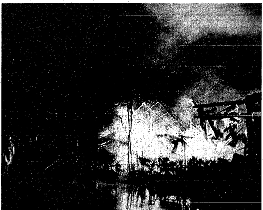
火災はちよつとした油断から...

春先は、空気が非常に乾燥し、強風が吹くことが多いことから、毎年この時期に火災が多発し、悲惨な焼死者が、身不自由者等を中心とした焼死防止対策の徹底、防火管理体制の確立が急務であります。