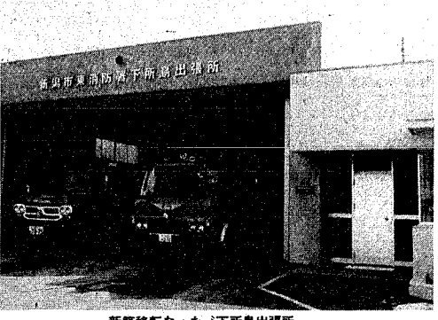
新築移転なった、下所島出張所

東消防署下所島出張所は、老朽化のため、昨年からの新築移転工事を進めていたが、このたび完成し、三月十八日から新しい出張所で業務を始めました。今後はより一層、地域の防災活動に活躍が期待されます。 新しいう出張所は、現在の出張所は、鉄筋コンクリート造の向かい側、約百五十坪、建り一部二階建て、延べ面積は約二百七十九平方坪、総工費は、幸町九番二十八、約五千万円。