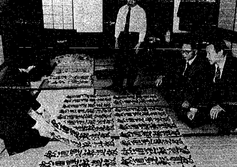
スラリそろった力作。「これはいい」と審査員の方々

この書き初め、交通安全を四校、作品数で五百六十点増の普及に役立つよう毎年、行われているもので、今年も行われていた。今年度の課題は、「交通安全」で、小学生は一年生から順に「いきなり」、「手ご合」、「七回目」。