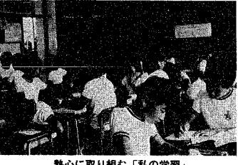
熱心に取り組む「私の学習」