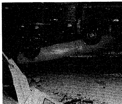
毎日発生する交通事故。お互いに十分気をつけましょう

自治会で一番手を焼いているのが、この処理の問題ではないかと思われる。私どもの自治会も、三百四十を超える世帯のごみ処理には、機会を度、繰り返し徹底を図っています。年末のごみ収集は二十九