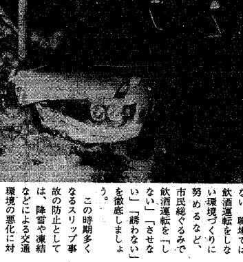
ドライバリの飲酒運転とスリップ被害を つて大破した乗用車

飲酒の機会が多くなる年末 年始をひかえ、市と市交通 対策協議会では、十一日から 一週間、市民の努力で追放 飲酒運転をスローガンに、 冬の交通事故防止運動を展 開します。 今回の重点は、飲酒運転の 追放、冬期における交通事故 防止、交通安全思想の普及、 冬期の交通安全防止運動を 中心とする。