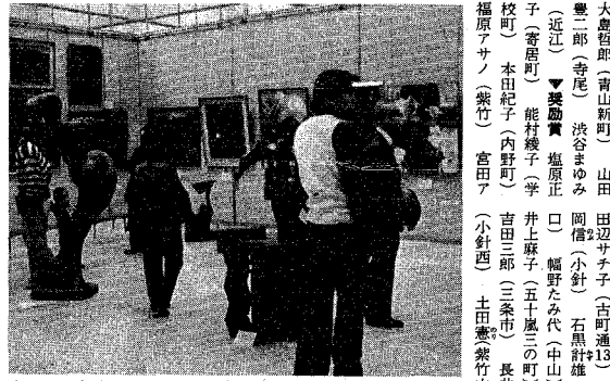
会場には多くの人々が訪れ、力作に見入っていました。

市民の力作を一堂に会し、第十二回新潟市美術展が、十一月十二日から十六日まで県民会館内の県美術博物館と震災ホールで開催され、多くの市民でにぎわいました。今年応募数は、洋画、日本画、書道、彫刻、工芸、版画、写真の七部門を合わせて九千八百五十五点、昨年のうちから各部門に市長賞と教育賞と教育賞が一点ずつ、美術協会賞十二点、奨励賞七十七点、入選五百五十五点が選ばれました。入賞おめでとうございませう。入賞者は次の方です。(敬称略。市長賞受賞者の氏名は一面に記載)