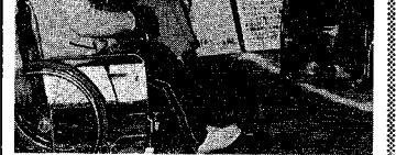
車椅子の介助方法を体験する参加者たち

福祉を身近なものとして知り、レクリエーション広場、ボランティア紹介コーナー、施設作品販売コーナー、障害者たち一千人が社会福祉センターに集まり、第一回福祉まつりを開きました。会場には車椅子介助体験コーナー、点字ふれあいコーナー、