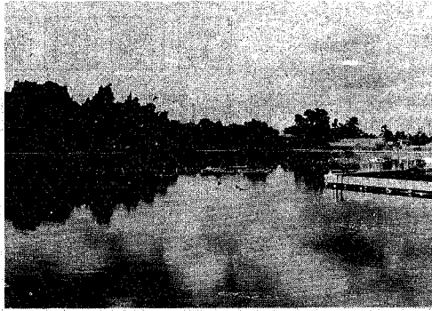
北山共有地組合が市へ寄付した北山池。(周囲約600m)