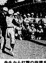
先生から打撃の指導を受ける野球部員

「きれいな学校とたくましい体力づくり」 ～五十嵐小学校～ 先生から打撃の指導を受ける野球部員