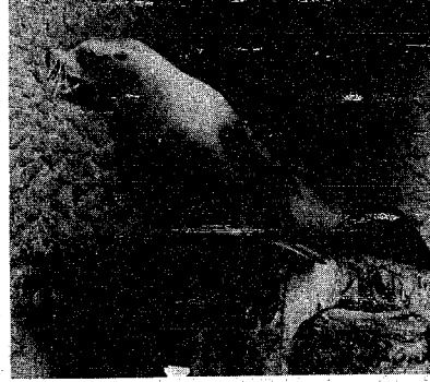
12月下旬から水族館に仲間入り

市の水族館に、十二月下旬から、新しい仲間トドが加わりました。このトド君は、現在小樽の水産館で飼育されているオスで、体重が一ツ、大きな牛程度という大物です。トドは、北海道では漁民の網を切つてしまつたため、海