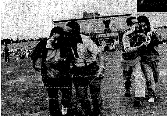
縁結びの紙 番号札を合わせてから、ほつべにテニスボール をはさみ肩を組んで仲良くゴールへ。縁結びの 神ならぬ紙で新カプルの誕生。「もっと早く知り合っていたなら ……」の冗談も飛び出す楽しいレース