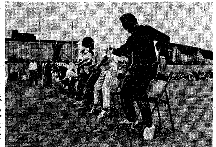
健康診断レース 紙コップに水を 入れた走り、中 間点にて風船をお尻で割る競技。さて、 診断の結果、高ケツアツ者が抽出したと か……