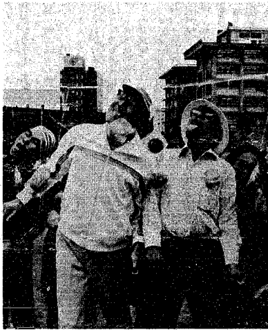
パン食い競争 昼食もどっし、おなか は満腹。でも競技ならゆ っくり気ながにとはいきません。「このパンは私 のもの」大きな口をあけてたがむしらに