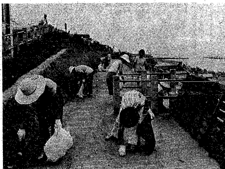
自主活動の盛んな海浜清掃(6日、金衛町浜で)

市民運動団体として誕生した「きれいなまちづくり運動実行委員会」も結成以来四年目を迎え、海浜、道路にと、活発なクリーン運動を展開しています。六日には金衛町浜での夏最後の海浜清掃を行い、この運動の着実な広がりを見せてくれました。また、実行委員会以外の団体の自主活動も年々盛んになり、地域ぐるみの環境美化の気運も一層高まりを見せています。