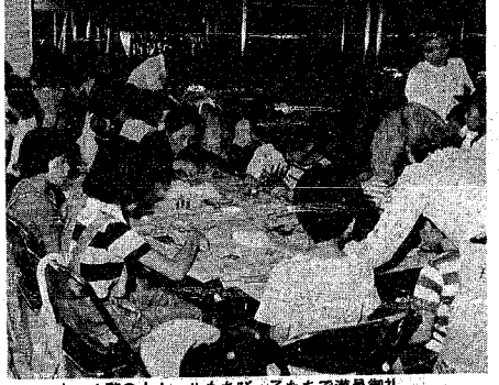
広い4階の大ホールもちびっ子たちで満員御礼 (8月26日ちびっ子広場で)

新和に完成した「鳥屋野地区センター」の中にある鳥屋野地区公民館では、きょう八月二十五日から三日間、オーブン記念行事が盛大に行われました。 このオーブン記念行事は、地元の人たちが中心となって企画したもので、音楽芸能発表会やちびっ子広場、青果物産地直売会、高校生のおしゃべりのついで、各種の一日講習会など、盛りだくさんです。 この会場予想以上の人が出て、会場の中へ入られず、はみ出す人も出るほどの盛況ぶりでした。 館内には鳥屋野地区の人たちの手作り作品も展示され、訪れた人たちの人気を呼んでいました。